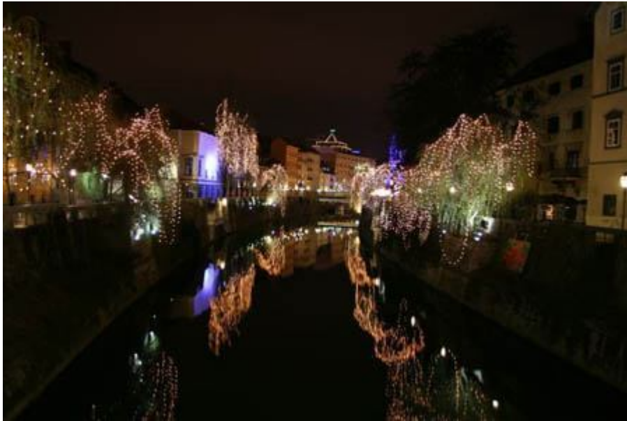
Jutranja Ljubljana dne 31.1. 2006 ob 5:15 uri