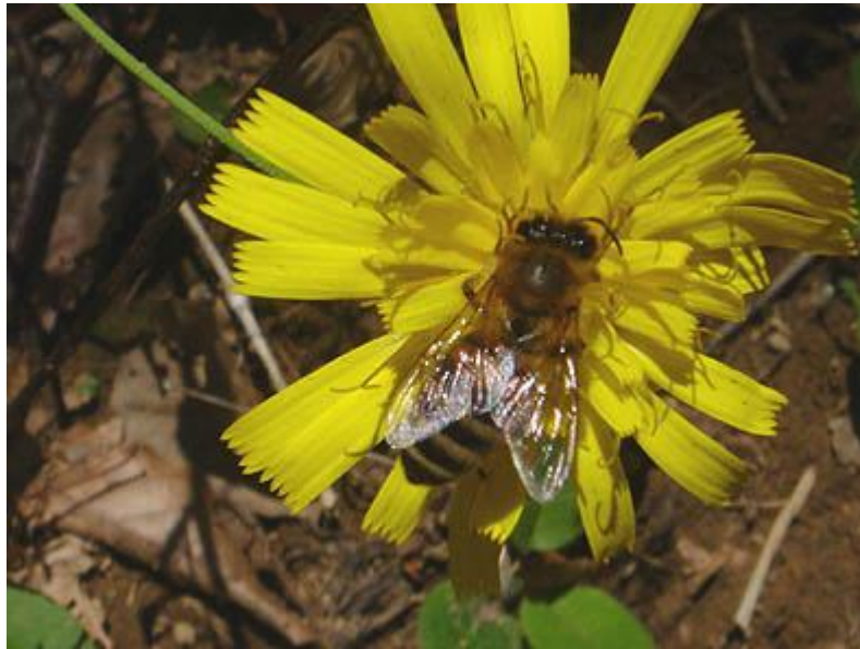
čebelica na cvetici